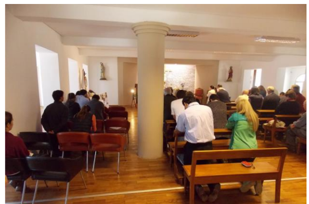
Escena de la Adoración al Santísimo en la Capilla de la Casa de Retiro.