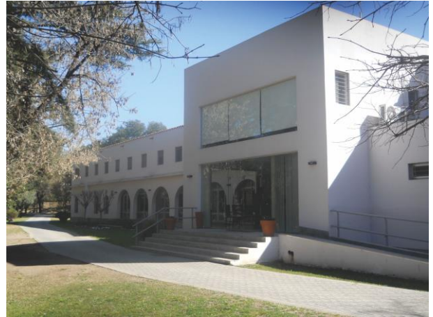
La Casa de Retiro “Catalina de María” de Villa Allende-Córdoba, donde se realizó el Cañamazo 2014.

Nuevamente, como en años anteriores, la Mater permitió pre-vivir escenas del Cielo aquí en la tierra, donde Matrimonios Federados se reencuentran y otros se conocen, pero todos unidos por el mismo Espíritu, Aquel que irrumpió con sus Gracias hace casi 100 años, el 18 de Octubre de 1914, y que hoy, en este nuestro tiempo, nos llama y nos dice, que “fieles al origen, fundemos de nuevo”, un Schoenstatt siglo II.