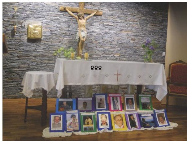
Los Hermanos Federados del Cielo presentes en el Cañamazo Jubilar.